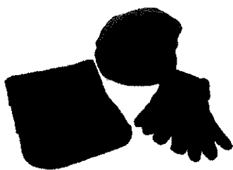
Set fular, caciula, manusi